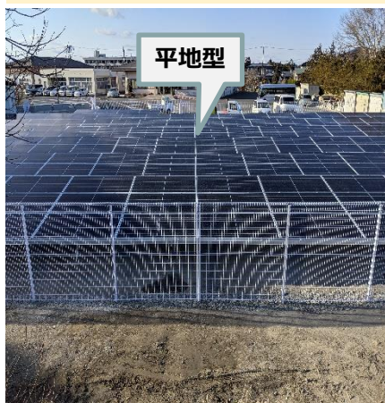
施設名: 大郷町役場