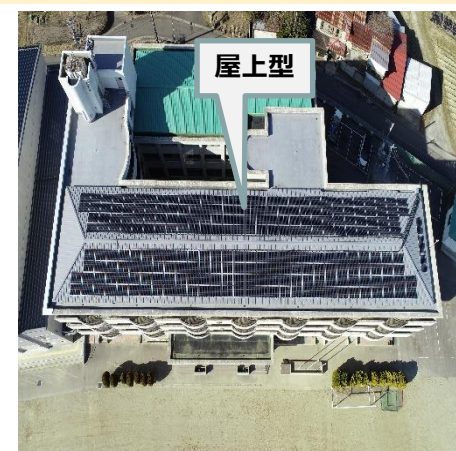
施設名: 大郷中学校