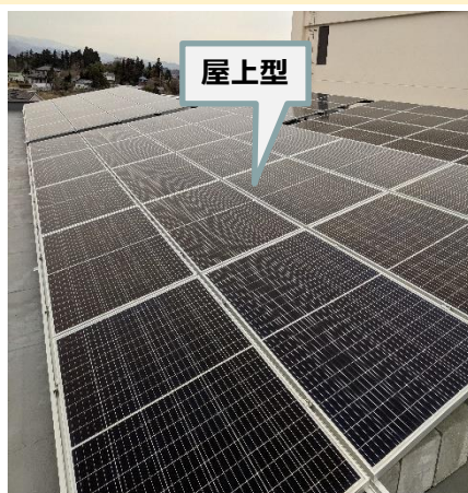
施設名: 大郷町文化会館